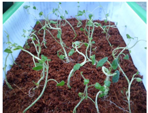
Hình 6. Cây con sâm Bồ Chính trồng trên giá thể xơ dừa ẩm

Cây sâm Bồ Chính in vitro hoàn chỉnh được chuyển ra vườn ươm trồng trên giá thể xơ dừa ẩm. Trong thời gian này cây phải được chăm sóc và bảo vệ trước những yếu tố bất lợi như: mất nước nhanh làm cây bị héo khô, nhiễm vi khuẩn và nấm gây ra hiện tượng thối nhũn, cháy lá do nắng, các loài côn trùng tấn công. Cây sâm Bồ Chính con sau 1 tuần (Hình 6) trồng trên giá thể xơ dừa ẩm đạt tỷ lệ sống 80%.