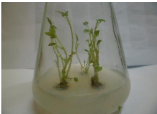
Hình 3. Cụm chồi sâm Bô Chính trên môi trường MS bổ sung 0,25 mg/L BA kết hợp 0,30 mg/L kinetin

Môi trường MS bổ sung BA và NAA cho kết quả nhân chồi cao hơn so với môi trường đối chứng không bổ sung chất ĐHSTTV. Môi trường bổ sung kết hợp BA (0,25 – 1,00 mg/L) và NAA (0,10 – 0,40 mg/L) đã kích thích tạo chồi in vitro . Trong tổ hợp với BA, khi tăng nồng độ NAA từ 0,10 – 0,30 mg/L số chồi thu được tăng, tuy nhiên khi tăng nồng độ NAA lên 0,40 mg/L số chồi hình thành giảm. Kết quả thu được cho thấy, tỷ lệ auxin/cytokinin có tác dụng phát sinh chồi, chồi nách và đặc tính của auxin là kích thích sự tăng trưởng và kéo dài tế bào, tăng trưởng chiều dài thân, lóng, chồi có tính ưu thế ngọn nên môi trường MS bổ sung 0,25 mg/L BA kết hợp 0,30 mg/L NAA cho hệ số nhân chồi cao nhất 2,63 lần, số lá/chồi 4,15 (chiếc lá), khoảng cách giữa các đốt thân dài, chồi khá, phiến lá nhỏ (Hình 3).