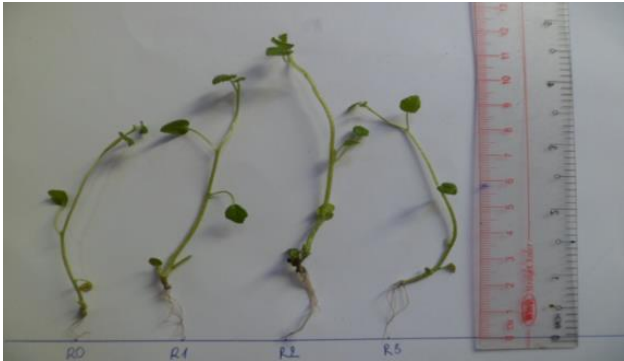
Hình 4. Chiều dài rễ sâm Bồ Chính tái sinh trên môi trường MS bổ sung NAA

Môi trường MS bổ sung 0,50 mg/L NAA cho hệ số tạo rễ (5,26 lần) tương tự kết quả của Bùi Văn Thế Vinh và cộng sự (2011) khi nhân giống in vitro cây Dầu mè ( Jatropha curcas L.) [6].