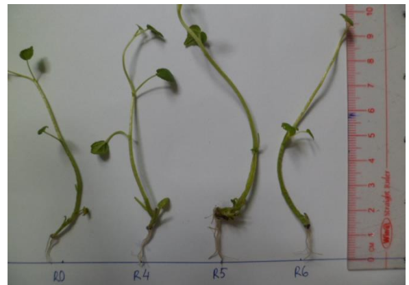
Hình 5. Chiều dài rễ sâm Bồ Chính tái sinh trên môi trường MS bổ sung IBA

trường MS bổ sung 0,50mg/L NAA là thích hợp tạo cây sâm Bồ Chính in vitro hoàn chỉnh. Kết quả của nghiên cứu này có hệ số tạo rễ (5,26 rễ/chồi) thấp hơn so với Phan Duy Hiệp và cộng sự (2014) (6,6 rễ/chồi) [4]. Sự