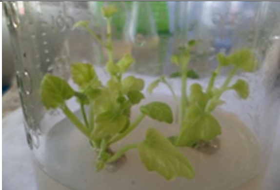
Hình 2. Cụm chồi sâm Bô Chính trên môi trường MS bổ sung 0,50 mg/L BA kết hợp 0,20 mg/L kinetin

Tham khảo kết quả nghiên cứu nhân giống cây dược liệu thân thảo của Hoàng Thị Thế (2013) khả năng tạo chồi cây Ba kích tốt nhất ở môi trường có bổ sung 1 mg/L BA kết hợp với 0,25 mg/L kinetin hệ số nhân chồi cao nhất (đạt 2,65 lần) [5], thấp hơn so với kết quả nhân chồi sâm Bô Chính ở nghiên cứu này với nồng độ BA 0,5 mg/L kết hợp kinetin 0,2 mg/L (3,04 lần). Vậy môi trường MS bổ sung BA 0,5 mg/L kết hợp kinetin 0,2 mg/L là môi trường thích hợp cho nhân chồi sâm Bô Chính.