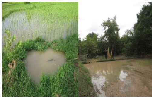
Ảnh 4. Sinh cảnh vũng nước động bên trong hay ven ruộng lúa nước (SC4)