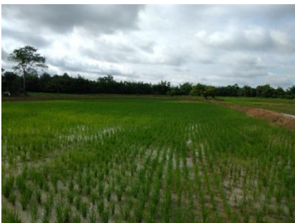
Ảnh 3. Sinh cảnh ruộng lúa nước (SC3)