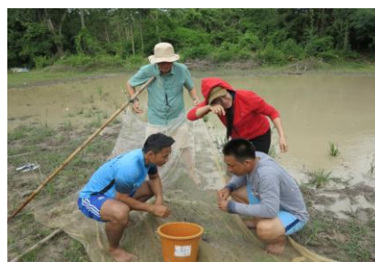
Ảnh 6. Phương pháp dùng lưới vớt thu bắt Cà cuống ở ngoài môi trường tự nhiên, nước CHDCND Lào