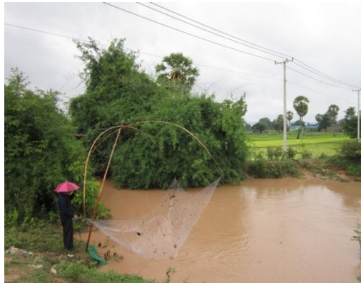
Ảnh 2. Sinh cảnh nước động (SC2) như ao, hồ hay đầm