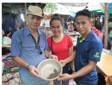
Ảnh 5. Thu mua mẫu Cà cuống bày bán cùng các thủy sản nước ngọt ở chợ thủ đô Viêng Chăn, nước CHDCND Lào