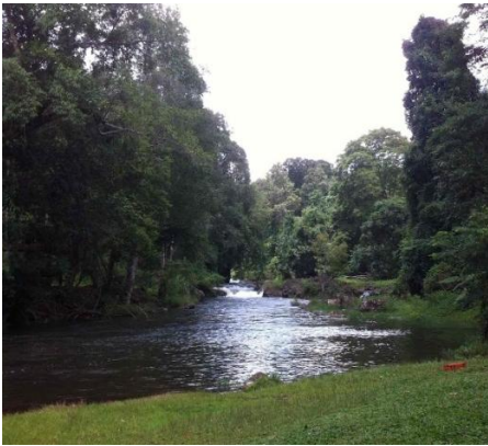
Ảnh 1. Sinh cảnh nước chảy (SC1) như kênh, rạch hay suối và sông

Chú thích: SC1 (Sinh cảnh nước chảy sông, suối và kênh), SC2 (Sinh cảnh nước không hoặc ít chảy ao, hồ và đầm), SC3 (Sinh cảnh ruộng lúa nước hay cây thủy sinh), SC4 (Sinh cảnh nước động trong hay ven trong ruộng lúa nước hay cây thủy sinh) và SC5 (Sinh cảnh sống khác như trên cạn, trôi theo dòng nước, nấp trong hang đất ven sinh cảnh thủy sinh).