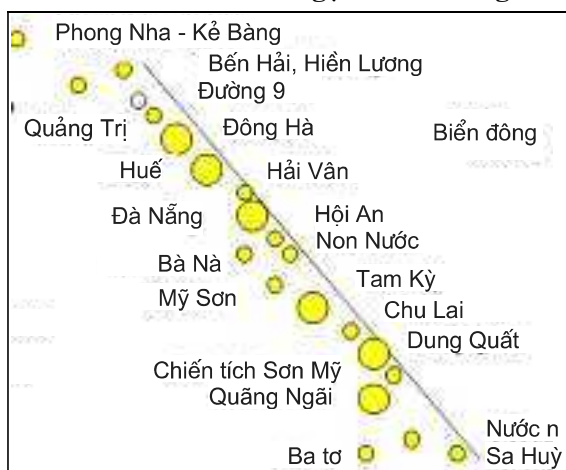
HÌNH 2: Chuỗi ngọc miền Trung

Nằm chính giữa chuỗi ngọc này Bắc Trung Bộ gồm 6 tỉnh trải dài từ Thanh Hoá vào đến Thừa Thiên Huế, là nơi có tiềm năng để phát triển du lịch bền vững. Thế mạnh của Vùng là tiềm năng du lịch di sản, văn hoá, lịch sử và du lịch biển. Tại đây tập trung 4 di sản văn hóa thế giới của Việt Nam đã được UNESCO công nhận, bao gồm Nhã nhạc cung đình và Quần thể di tích triều Nguyễn (Thừa Thiên Huế); Phong Nha - Kẻ Bàng (Quảng Bình) và thành Nhà Hồ (Thanh Hóa). Đây cũng là khu vực có nhiều di sản văn hóa, lịch sử nổi tiếng đan xen như khu di tích làng Sen quê Bác (Nghệ An), Ngã ba Đồng Lộc (Hà Tĩnh)... cùng nhiều lễ hội truyền thống đang được bảo lưu. Mặt khác, vùng BTB cũng nằm trong “ Con đường di sản miền Trung ” con đường di sản này có mục tiêu kết nối các di sản thế giới tại Trung Bộ, bao gồm: Vườn quốc gia Phong Nha-Kẻ Bàng (Quảng Bình); cố đô Huế với hai di sản là Quần thể di tích Cố đô Huế và Nhã nhạc cung đình Huế; tỉnh Quảng Nam với hai di sản là: Thánh địa Mỹ Sơn và đô thị cổ Hội An. Tất cả những điều đó tạo điều kiện thuận lợi để các địa phương trong vùng Bắc Trung Bộ xây dựng những chương trình liên kết vùng để phát triển du lịch.